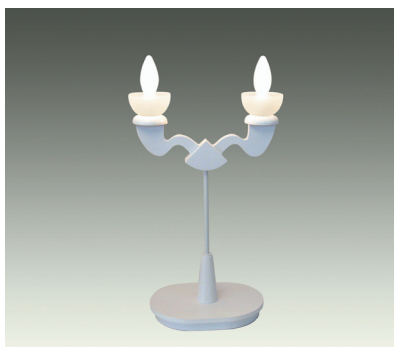
S8050-W ¥47,000 (税抜)