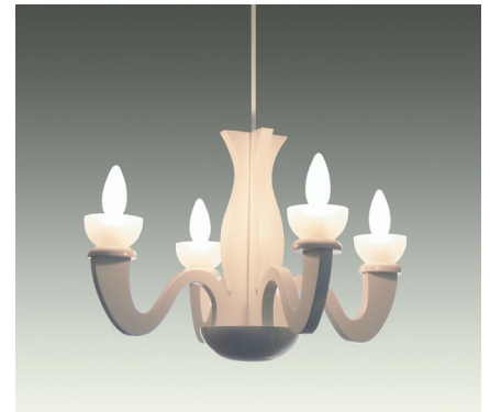
C2020-W ¥69,000 (税抜)