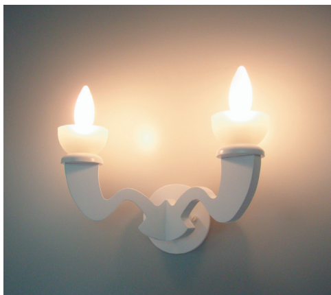
B1015-W ¥33,000 (税抜)