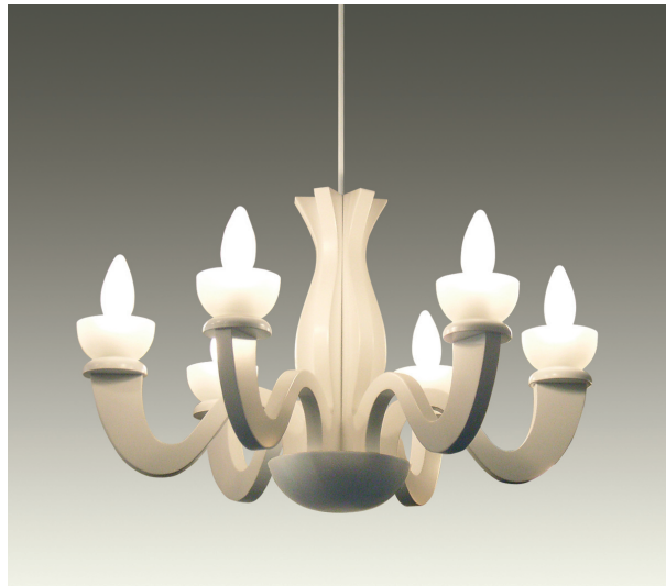
C2019-W ¥89,000 (税抜)