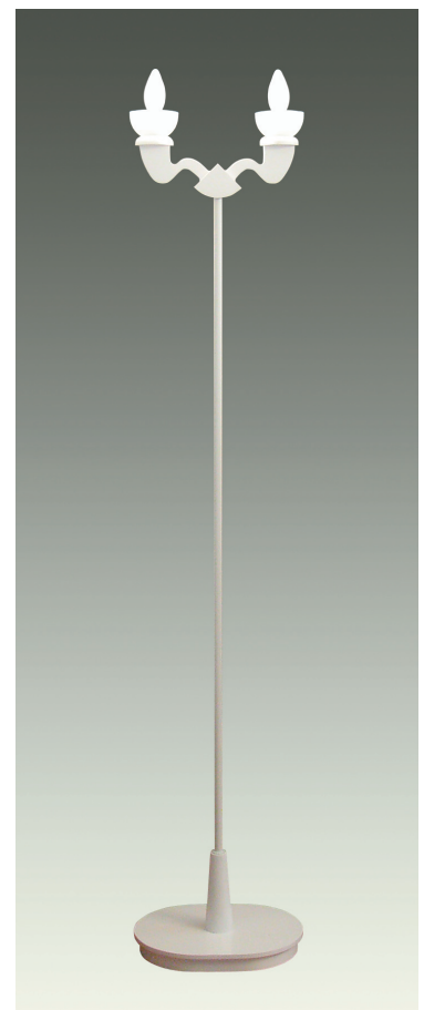
F3198-W ¥58,000 (税抜)