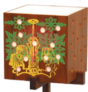
TC シルクスクリーン