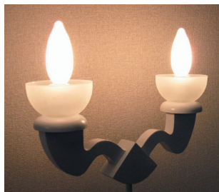
F3198-W 本体 拡大

2003年、桶田麻郁とNAMIKI DESIGNを設立し、オリジナルデザイン製品の開発を始める。現在は、照明器具のデザインを中心に幅広くデザインプロジェクトを手掛ける。