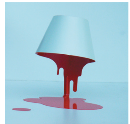
S8063LE-WR ¥21,400 (税抜)