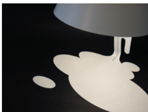
零一滴をお好きな場所に