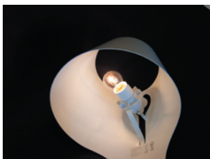
ソケット台一体式セード