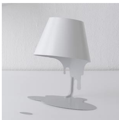
S8063LE-W ¥22,470 (税抜¥21,400)