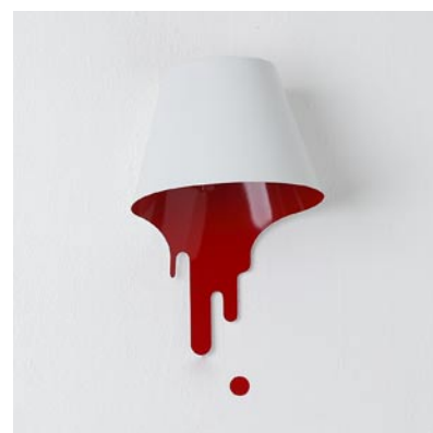
B1018LE-WR ¥24,570 (税抜¥23,400)