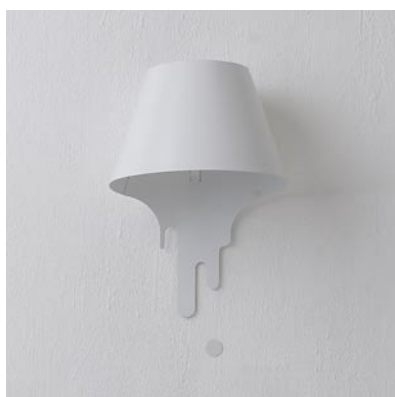
B1018LE-W ¥21,420 (税抜¥20,400)