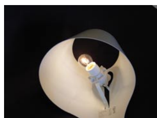
ソケット台一体式セード

同年静岡県立美術館にて個展「TWO DAYS & FOUR PRODUCTS」を開催。同5月、NYで開かれたICFF(NY)にイタリアのdesignboomより参加など、作品は特に欧米諸国で高く評価され、世界中でエキシビションを開催。アートと音楽、デザインを横断するデザイナーとして期待されている。