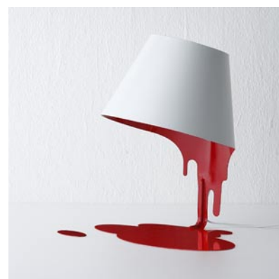
S8063LE-WR ¥25,620 (税抜¥24,400)