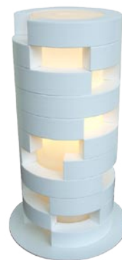
S8030LE-W ¥38,850(税抜 ¥37,000)