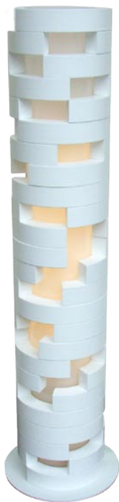
F3186-W ¥58,800(税抜 ¥56,000)

1974年神奈川県生まれ 東海大学工学部建築学科卒業 住宅会社等を経て現在、建築関係の仕事に従事すると共に、フリーランスデザイナーとして活動中。 ・環境の情報という素材 環境の変化の建築への参加 (社) 日本インテリアデザイナー協会主催 2002年 JID賞 ・フルツトレイ 京都デザイン優品 2004に認定 ・大川家具工業組合主催 国産材使用家具デザインコンペティション大川 2007入選 ・De Padova社主催 living simplicity in furniture インターナショナルデザインコンペティション 2007 上位 140選 (応募総数 5402点 98カ国)