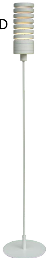
F3187LE ¥50,820(税抜 ¥48,400)

セントラル・セント・マーチン大学院 (ロンドン)、インダストリアルデザイン科卒。株式会社バンダイ (製品設計)、株式会社アノオフィス (工業デザイナー) を経て独立。2010年に株式会社アノデザインオフィスを設立。プロダクト全般のデザインを手掛ける。