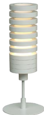
S8031LE ¥37,170(税抜 ¥35,400)